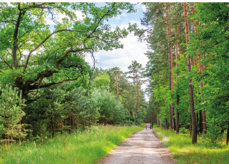
Pętla Lasy Rudzkie

wej. Kolej wąskotorowa, która kursowała tutaj od początku XX wieku, łączyła Gilwicę z Raciborzem i liczyła 51 km. Była niezwykle popularna, bo bardzo wygodna, przez co do 1945 roku liczba przewożonych osób dochodziła do 700 tysięcy osób w skali roku, a w latach 1949-63 nie spadała poniżej miliona! Stacja w Rudach była największą na trasie. Znalazły się tam warsztaty naprawcze taboru, tory postojowe dla wagonów i lokomotyw, punkt obrzadzania parowozów i trójką torowy do ich obracania. Pociągi pod szyldem PKP regularnie kursowały tutaj do 1991 roku. Dziś 51-kilometrowego odcinka został tylko siedmiokilometrowy ze Stacji do Stodół. Stacja w Rudach znajduje się na Szlaku Zabytków Techniki województwa śląskiego, a wśród atrakcji oferowanych turystom jest zwiedzanie stacji i hali lokomotywowni, przejazd kolejką na trasie Rudy-Stodoly oraz Rudy-Stanica, a także dreźna na terenie stacji. Prócz tych dwóch wielkich i znanych atrakcji turystycznych województwa śląskiego, w Lasach Rudzkich natopkać można wiele miejsc upamiętniających ważne wydarzenia, uroczysk, ukrytych w lesie stawów i oczek wodnych.