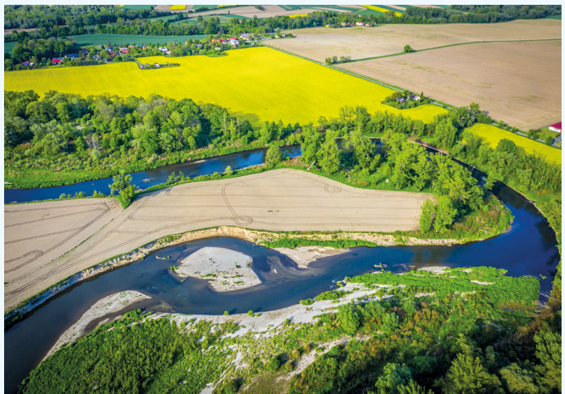
Graniczne Meandry Odry

Szlak ułożony jest w formie pętli, ale dobrym miejscem jego rozpoczęcia jest dworzec PKP w Chałupkach, znajdujący się bezpośrednio przy szlaku. Ci, którzy wolą dojechać samochodem, mogą skorzystać z parkingu przy Meandrach Odry i tam rozpocząć wycieczkę.