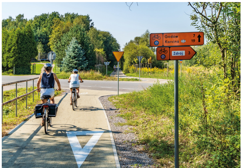
Żelazny Szlak Rowerowy

W Czechach pomarańczowe tabliczki zmieniają się w żółte, ale na szczęście logo szlaku pozostaje. U naszych południowych sąsiadów oznakowanie jest rzadsze, mniej intuicyjne i bardziej skomplikowane (jeden czeski znak kierunkowy zastępuje kilka tabliczek w Polsce, dlatego trzeba bardziej skoncentrować się na znakach). Na czeskim odcinku Żelaznego Szlaku Rowerowego jest dużo informacji o skrzyżowaniach z innymi szlakami, ale niestety brakuje tablic informacyjnych z mapą szlaku, która ułatwiłaby czytelność kierunku jazdy na rozwidleniach.