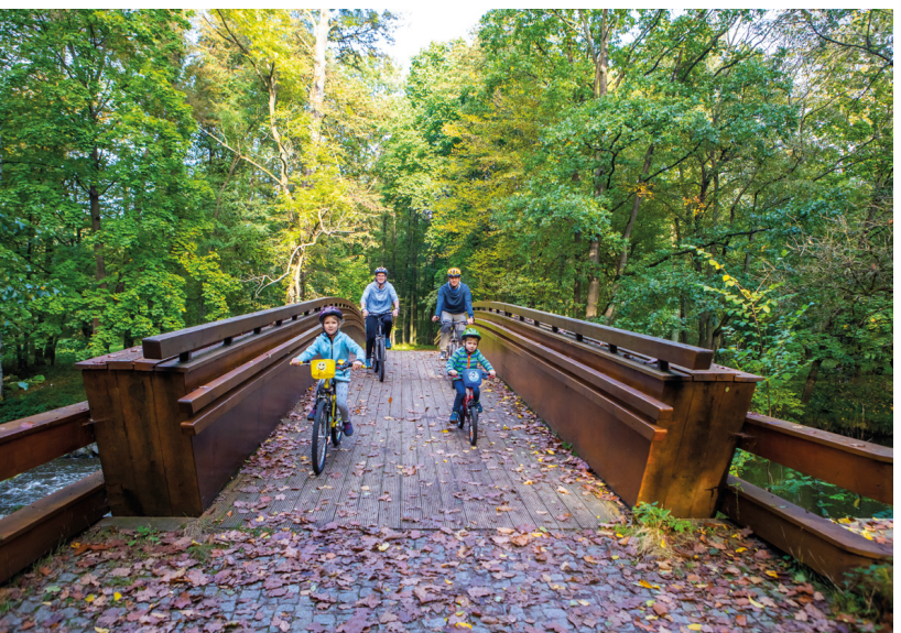
Pętla Lasy Rudzkie, fot. M. Giba

wej. Kolej wąskotorowa, która kursowała tutaj od początku XX wieku, łączyła Gilwicę z Raciborzem i liczyła 51 km. Była niezwykle popularna, bo bardzo wygodna, przez co do 1945 roku liczba przewożonych osób dochodziła do 700 tysięcy osób w skali roku, a w latach 1949-63 nie spadała poniżej miliona! Stacja w Rudach była największą na trasie. Znalazły się tam warsztaty naprawcze taboru, tory postojowe dla wagonów i lokomotyw, punkt obrzadzania parowozów i trójką torowy do ich obracania. Pociągi pod szyldem PKP regularnie kursowały tutaj do 1991 roku. Dziś 51-kilometrowego odcinka został tylko siedmiokilometrowy ze Stacji do Stodół. Stacja w Rudach znajduje się na Szlaku Zabytków Techniki województwa śląskiego, a wśród atrakcji oferowanych turystom jest zwiedzanie stacji i hali lokomotywowni, przejazd kolejką na trasie Rudy-Stodoly oraz Rudy-Stanica, a także dreźna na terenie stacji. Prócz tych dwóch wielkich i znanych atrakcji turystycznych województwa śląskiego, w Lasach Rudzkich natopkać można wiele miejsc upamiętniających ważne wydarzenia, uroczysk, ukrytych w lesie stawów i oczek wodnych.