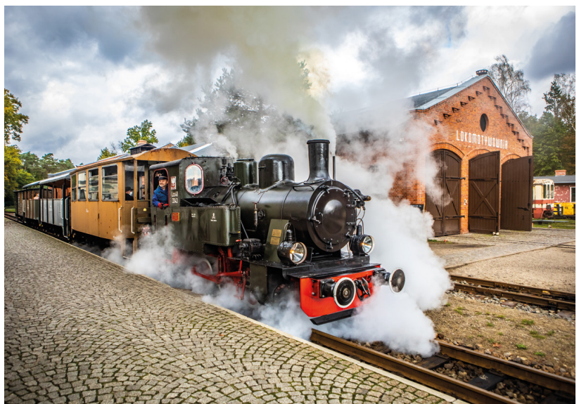
Kolej Wąskotorowa w Rudach

Do Rud, gdzie znajduje się miejsce rozpoczęcia szlaku, można dojechać samochodem. Tuż przy Zespole Klasztorno-Pałacowy jest duży parking. Inne znajdują się w Brantolce przed wjazdem do lasu oraz w Paproci. Ci, którzy chcą na szlak