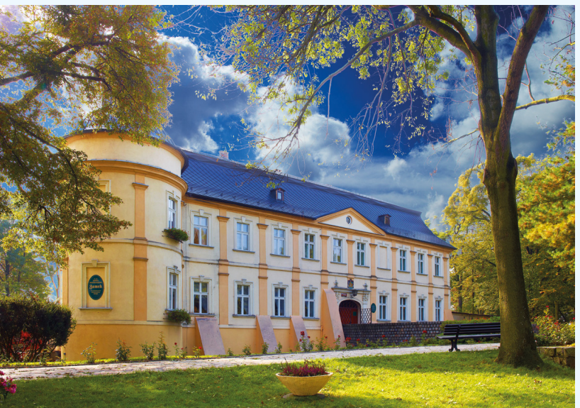
Pałac w Chałupkach

Zdecydowanie najciekawszym i najlepszym odcinkiem szlaku są Graniczne Meandry Odry w Chałupkach . To unikatowy w skali europejskiej obszar chronionej fauny i flory, wpisany do sieci Obszarów Chronionych NATURA 2000. To miejsce, gdzie przyroda zachowała swój dziewiczy charakter, a koryto rzeki kształtowała natura, a nie działalność człowieka. Przy 3,5-kilometrowej ścieżce dydaktycznej, dostępnej dla pieszych i rowerzystów, znajdują się tablice informacyjne, miejsca odpoczynkowe oraz wieża widokowa. Wieża ma 27 metrów wysokości, ulokowana jest w bliskości rzeki, a z jej góry rozpościera się zapierający dech w piersiach widok na polsko-czeskie pogranicze. Innym bardzo ciekawym miejscem na szlaku jest zamek w Chałupkach . Jest to średniowieczna twierdza w stylu barokowym, otoczona parkiem z okazami starodrzewia. Dziś zamek pełni funkcję hotelu i restauracji, a w parku znajdują się miniaturowe śląskie zamki i pałaców. Po zachodniej stronie Odry, szlak prowadzi lokalnymi drogami samochodowymi, w kierunku polsko-czeskiej granicy (którą zresztą na krótkim odcinku jest poprowadzony), zapewniając widoki na pola uprawne i wioski.