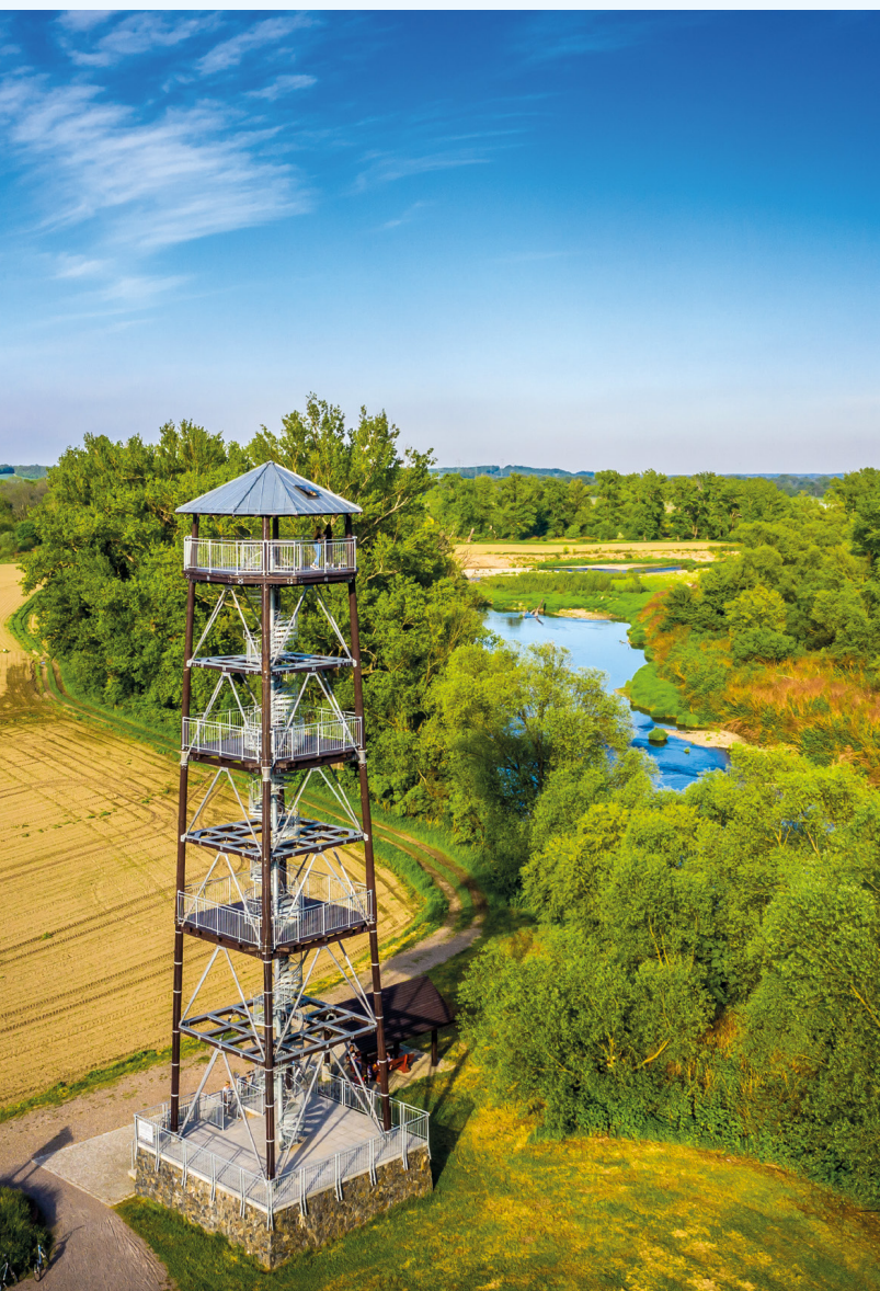
Wieża widokowa przy Granicznych Meandrach Odry

także znaki z kilometrażem do końca pętli oraz do najbliższych atrakcji turystycznych. Dodatkowo spotkać można tablice informacyjne z mapą szlaku.