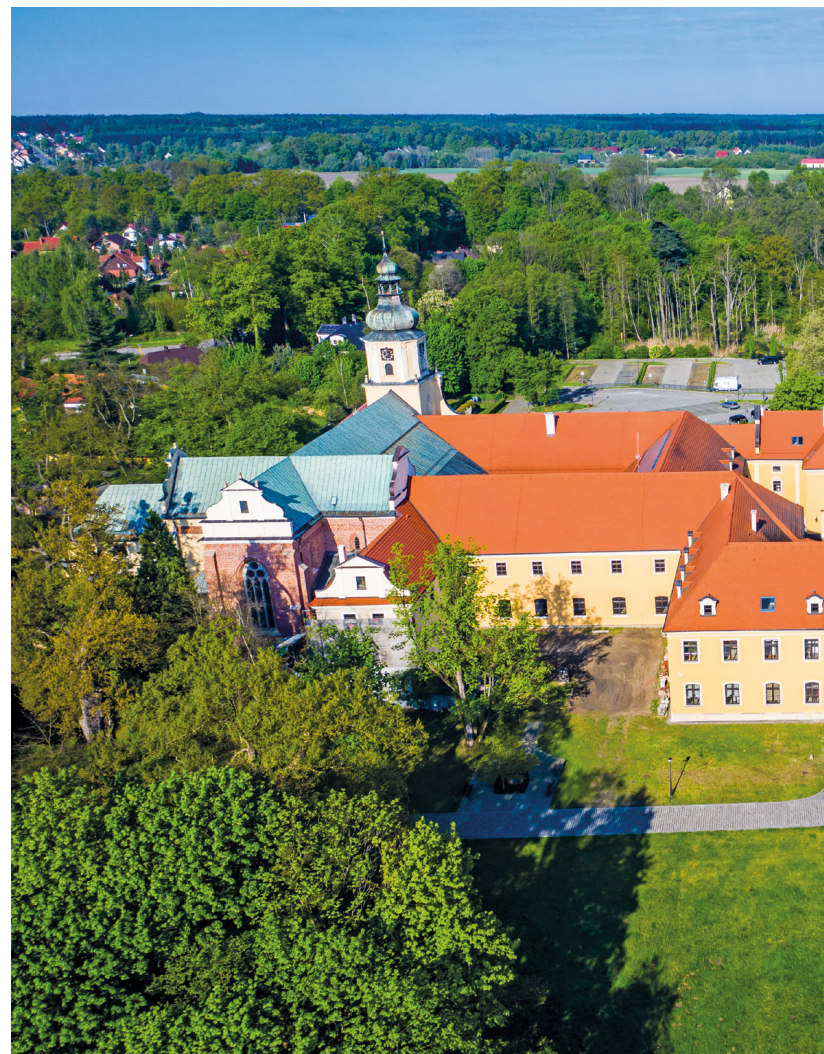
Zespół Klasztorno-Pałacowy w Rudach