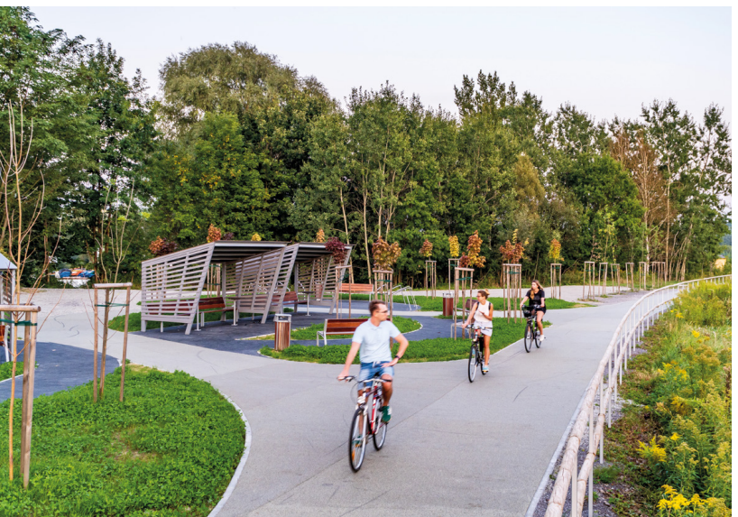
Żelazny Szlak Rowerowy

Po polskiej stronie Żelazny Szlak Rowerowy wykorzystuje stare i nieużywane linie kolejowe, którym zresztą szlak zawdzięcza swoją nazwę. Od Godowa przez Jastrzębie-Zdrój do Zembrzydowic jedzie się fantastyczną drogą rowerową z mineralno-żywniczą nawierzchnią. Odcinek ma 15 km i utworzony został na nasypie dawnej linii kolejowej. Jest wyłączony z ruchu samochodowego, a co kilka-set metrów znajdują się miejsca odpoczynkowe z ławką, stolikami i stojakiem rowerowym, a także cztery duże miejsca odpoczynkowe (tzw. MOR-y) oraz dwa z automatycznym defibrylatorem zewnętrznym i samoobsługową stacją naprawy rowerów. Kolejny odcinek wyłączony z ruchu samochodowego i utworzony na na-