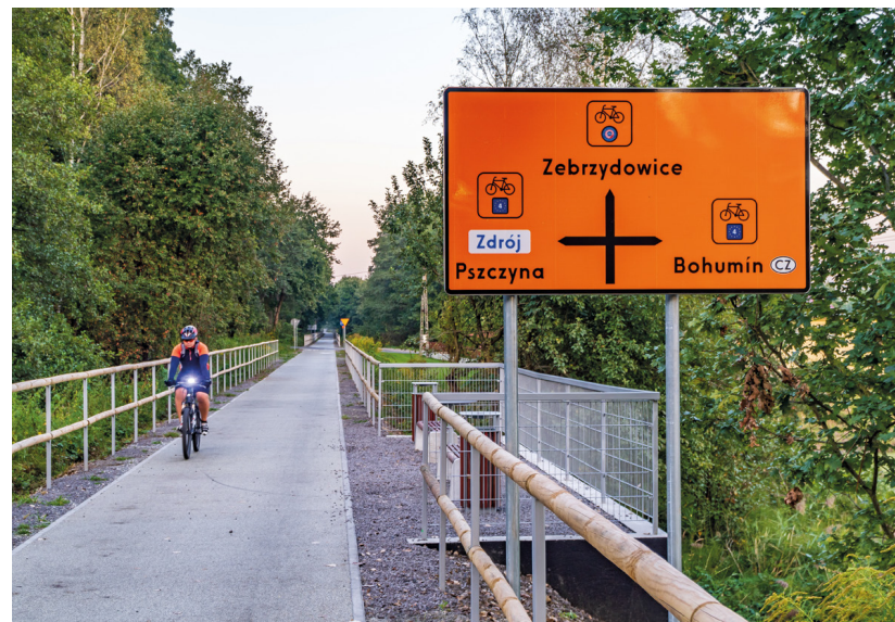
Żelazny Szlak Rowerowy

Na obszarze Jastrzębia-Zdroju ciekawym miejscem jest dolina rzeki Szotkówki , gdzie mają swoje siedliska bobry i wydry europejskie oraz Las Białoszek , w którym rośnie buk „Jakub” – najstarsze drzewo w Jastrzębiu-Zdroju. Jedną z najciekawszych atrakcji Jastrzębia-Zdroju jest Park Zdrojowy , założony na początku lat 60. XIX wieku, w którym mieszczą się Dom Zdrojowy, Galeria Historii Miasta oraz inhalatorium solankowe. W 2023 r. otwarta została w Jastrzębiu-Zdroju nowoczesna multimedialna wystawa Carbonarium , poświęcona historii węgla i tradycjom górniczym miasta.