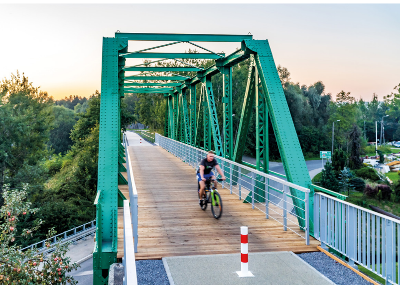
Żelazny Szlak Rowerowy

Czeska strona Żelaznego Szlaku Rowerowego różni się od polskiej. Tutaj dominują asfaltowe drogi publiczne, które łącznie stanowią 67% czeskiej części szlaku. Pozostała część to drogi wyłączone z ruchu samochodowego. W Karwinie drogi rowerowe są bardzo różne. Mają nawierzchnie asfaltową lub z kostki brukowej. Najlepsza droga rowerowa znajduje się na wałach Olzy w Karwinie, a najstarsze są często popękane asfaltowe alejki w Parku Zdrojowym. W Piotrowicach koło Karwiny natomiast występują drogi z zakazem ruchu dla samochodów, po których jazda jest dużą przyjemnością.